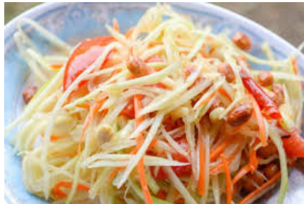
Salade de papaye verte