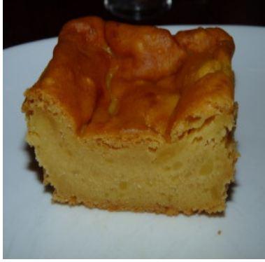
Gateau de fruit à pain