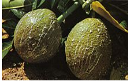
Fruit à pain