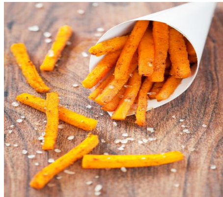
Frites de patate douce

Une autre partie de notre production est destiné à la vente aux visiteurs de notre structure. L'association exercera des activités économiques par la vente de produits et de services en lien avec ses activités pédagogiques, dans le but de subvenir à ses besoins de fonctionnement et d'emploi de salariés nécessaires à l'atteinte de ses objectifs. Elle reste à but non lucratif et les bénéfices, si bénéfices il y a, seront réinvestis dans le développement de ses activités, dans les aménagements nécessaires à son fonctionnement ou dans l'amélioration des conditions d'accueil du public.