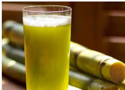
Jus de canne à sucre