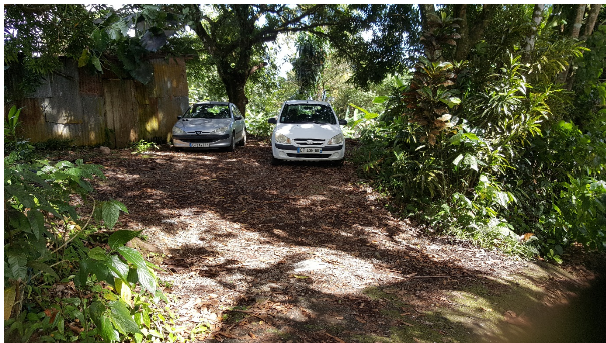
Emplacement actuel des futurs bâtiments de la micro ferme

Le paradis vert, c'est 2 hectare de terrains de culture qui sont gracieusement mis à disposition par les familles JAFFARD et CLARY au lieu-dit « concession » sur les hauteurs de la commune de Capesterre belle-eau. Des terres qui se trouvent à proximité d'une rivière et le terrain lui-même est traversé par une source d'eau.