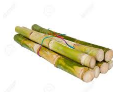
Canne à sucre